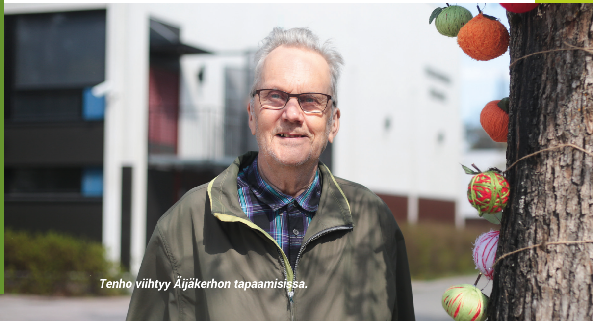
Tenho viihtyy Äijäkerhon tapaamisissa.

tänne ei muuten otetakaan, mutta on hyvä piristys, kun vetäjäksi on valittu mukavia ja iloisia naisia. Äijäkerho on ollut oikein antoisa ja mielenkiintoinen. Meikäläinen viihtyy täällä niin kauan kuin jalka nousee.